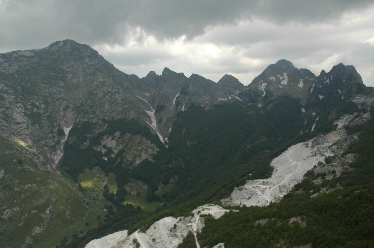
Val Serenaia Monte Pisanino, Zucchi di Cardeto Monte Cavallo e Monte Contrario