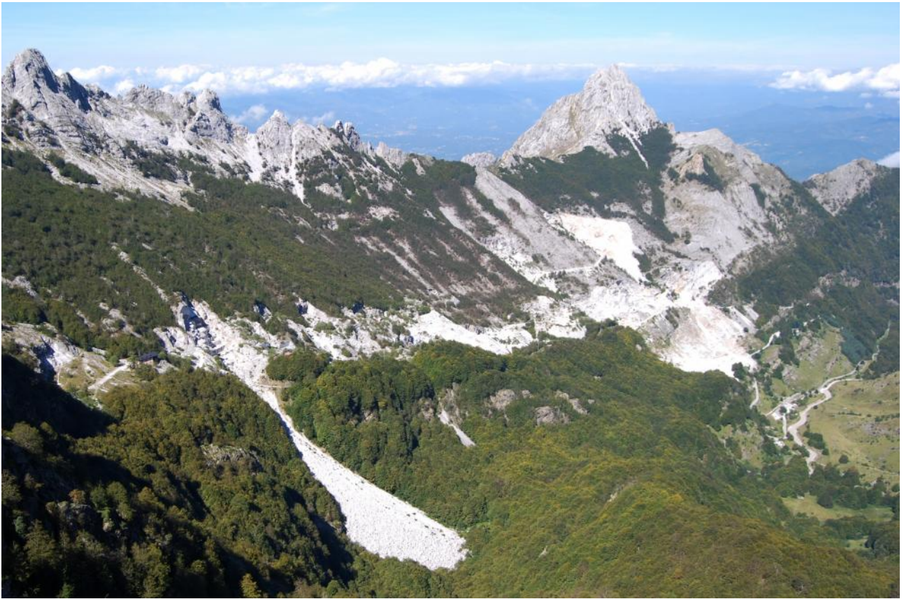
Val Serenaia con Pizzo d'Uccello e Cresta Garnerone