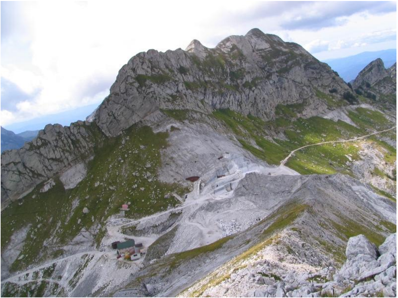
Il passo della focolaccia